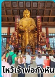
ไหว้เจ้าพ่อก้งหัน