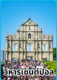
วิหารเซนต์ปอล