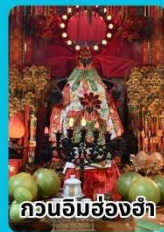
กวนอิมฮ่องกง