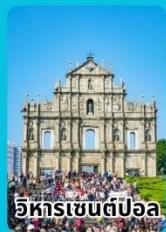
วิหารเซนต์ปอล