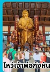
ไหว้เจ้าพ่อก้งหัน