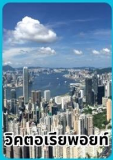
วิวทิวทัศน์ฮ่องกง