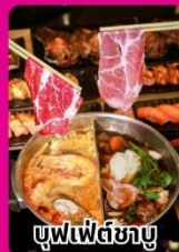
บุฟเฟ่ต์ซ่ามู