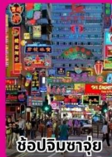
ช้อปปิ้งซ่ามู