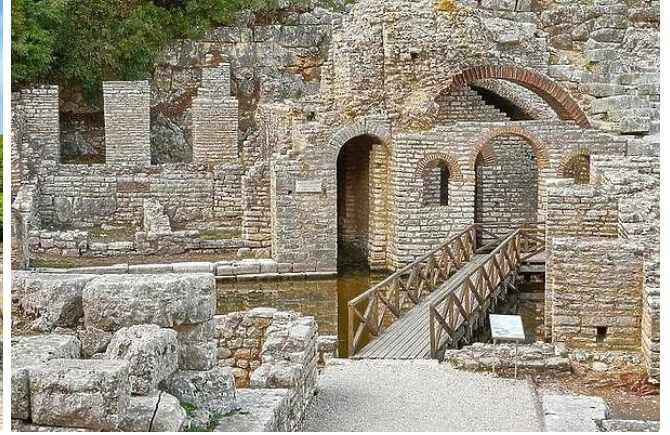
ไม่ไกลกันนัก พาท่านเที่ยวชม Shrine of Shklepio ซึ่งประกอบไปด้วย Ancient Theatre และ Roman Bath