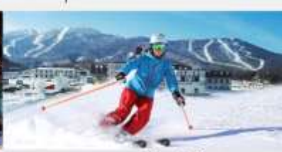
ลานสกียาปูสี่

*ทางบริษัทฯ ขอสงวนสิทธิ์ในการสลับโปรแกรมทัวร์ตามความเหมาะสมขึ้นอยู่กับสถานการณ์หน้างาน โดยคำนึงถึงผลประโยชน์ของลูกค้าเป็นสำคัญ