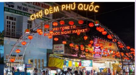
ตลาดกลางคืน

*ทางบริษัทฯ ขอสงวนสิทธิ์ในการสลับโปรแกรมทัวร์ตามความเหมาะสมขึ้นอยู่กับสถานการณ์หน้างาน โดยคำนึงถึงผลประโยชน์ของลูกค้าเป็นสำคัญ