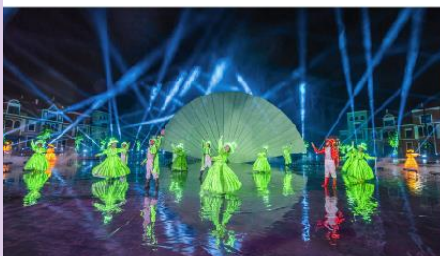
โชว์ที่ Grand World