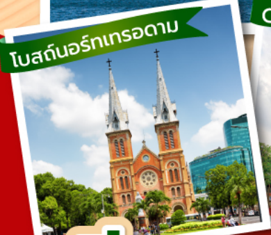
โบสถ์นอร์ทเทรอดาม