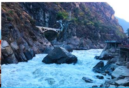
ช่องแคบเสื่อกระโถน