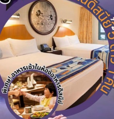
พิเศษ! อาหารเข้าในห้องอาหารฟรี