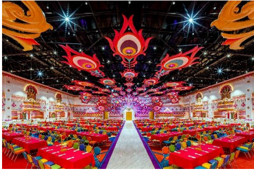
หลังอาหาร ชมการแสดง