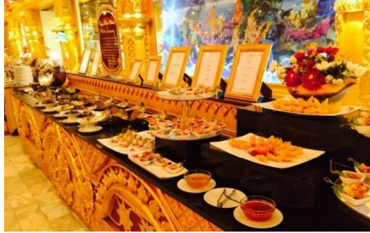
หลังอาหาร ชมการแสดง