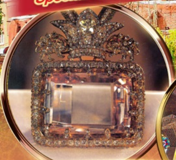
NATIONAL JEWELRY MUSEUM