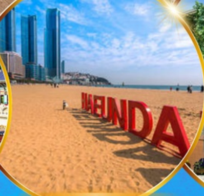
หาดแฮนแด