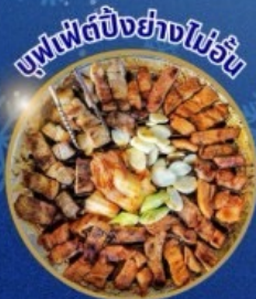
บุฟเฟ่ต์ปิ้งย่างไม่วัน