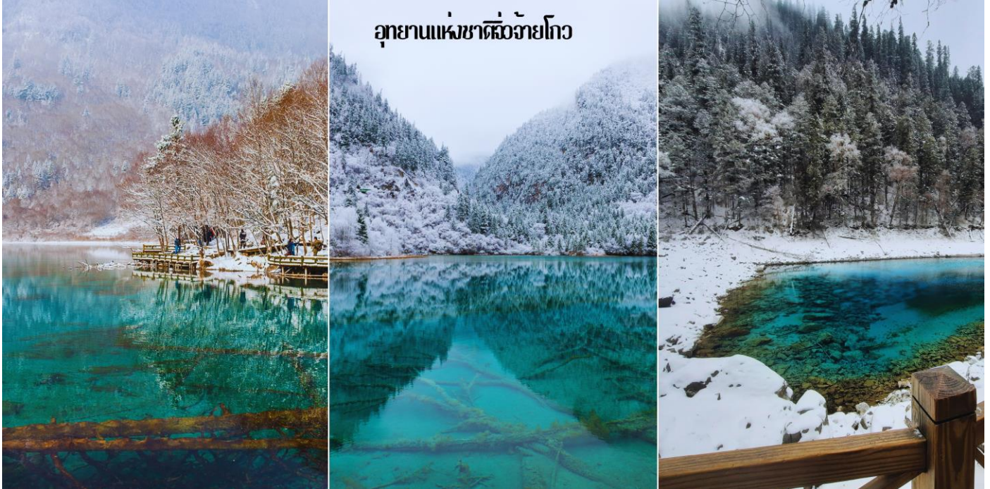
อุทยานแห่งชาติจิวจ้ายโกว

เช้า ๑๐ | รับประทานอาหารเช้า ณ ห้องอาหารของโรงแรม (5)