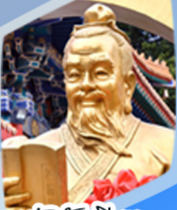
หลวงดำเซ็งน