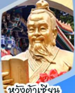
หวังต้าเซียน