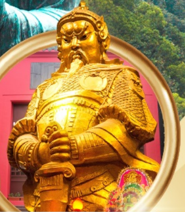
วัดเขangkหมิว