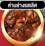
ห่านย่างรสเลิศ