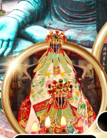
ยืมเงินเจ้าแม่กวนอิมสองห้า