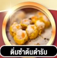
ติ่มซำต้นตำรับ