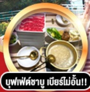
บุฟเฟ่ต์ชาบู เมียร์มออิน!!