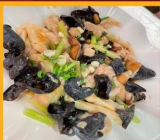
ไก่ผัดเห็ดหูหนู