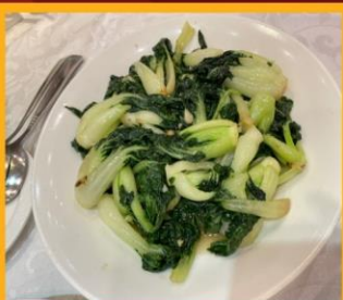
ผัดผักตามฤดูกาล