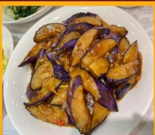
มะเขืออบหม้อดิน