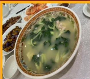
ซุปรังไก่หมู