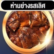
ห่านย่างรสเลิศ