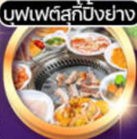
บุฟเฟ่ต์สุกี้ปิ้งย่าง