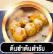
ต้มซ่าดับคำรับ