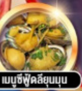
เมนูซีฟู้ดลือลุ่ม