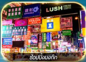
ช้อปปิ้งมงก๊ก

เต็มอิ่มทั้งบุญ และ ช้อปปิ้งแบบจัดเต็ม จิมซาจุ่ย มงก๊ก เกาะฮ่องกง ชมวิวอ่าววิคตอเรีย วัดเจ้าแม่กวนอิม เจ้าแม่กวนอิม หาดริฟลีส์เบย์ วัดหลินฟ้า โรงงานจิ๋วเวอร์รี่