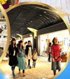
อิสระช้อปปิ้ง Tenjin Underground