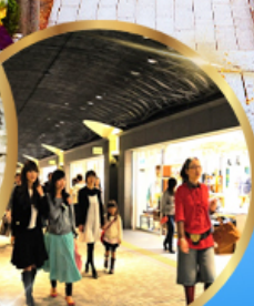
อิสระช้อปปิ้ง Tenjin Underground