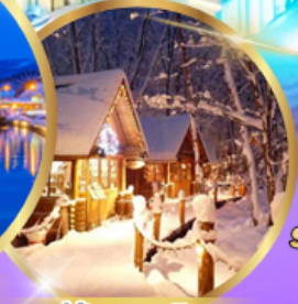
หมู่บ้านเทพนิยาย นิงเกิลเทอเรส