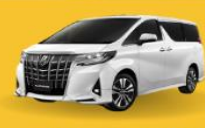
Alphard (2-4 ท่าน)