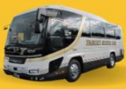
Bus (10-20 ท่าน)

สำหรับท่านที่ต้องการความเป็นส่วนตัวมากขึ้น ท่านสามารถเลือกใช้บริการ รถส่วนตัวได้ โดยมีรูปแบบรถให้เลือกถึง 3 ประเภท โดยรถ แต่ละประเภท สามารถนั่งได้ตั้งแต่ 2 ท่านขึ้นไป