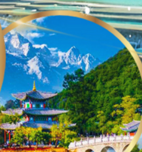
สระมิงกรดำ