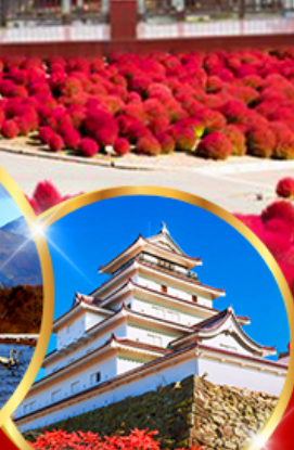
ปราสาทสิรุกะ