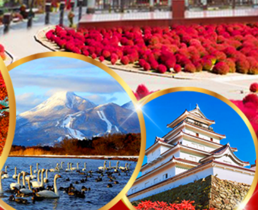
ทะเลสาบอินาวะชิโระ