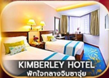
KIMBERLEY HOTEL พักใจกลางอิมซาจู้ย