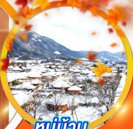
หมู่บ้าน นากาฮิบซอง