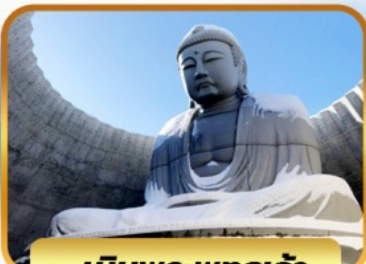
เป็นพระพุทธรเจ้า

05-10, 12-17, 19-24 พ.ย. 26 พ.ย. - 01 ธ.ค. 67