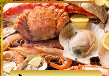
บั้งย่างร้านดังนั้นตะ