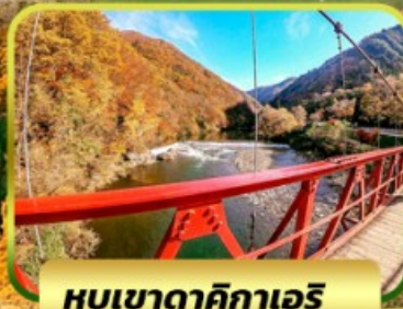
หุบเขาดาคิกาเอริ