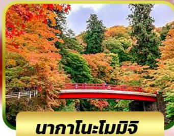
นากาโนะโมมิจิ