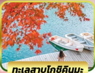
ทะเลสาบโกชิคิคุมะ