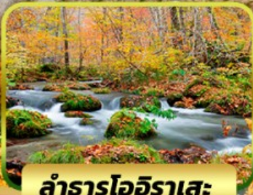
ลำธารโออิราเสะ