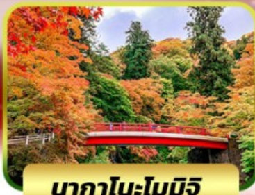
นากาโนะโมมิจิ