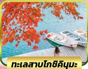
ทะเลสาบโกชิคิคุมะ