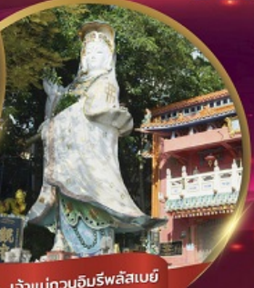
เจ้าแม่กวนอิมรพีลิสเบย์