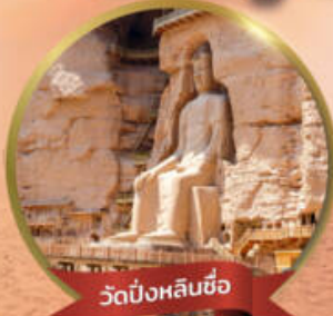
วัดป๋องหลินซื่อ