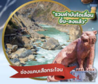
"รวมค่าบินโตเลื่อง บิน-ลงแล้ว"