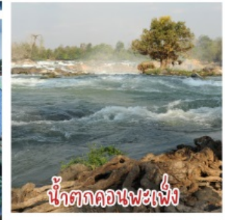
น้ำตกคอนพะเพ็ง