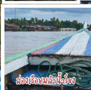
ล่องเรือชมลิ้นน้ำโขง