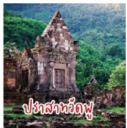
ปราสาทวัดพู