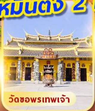
วัดซอพรเทพเจ้า