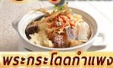
พระกระโดดกำแพง