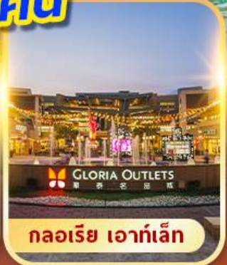
กลอเรีย เอาท์เล็ต