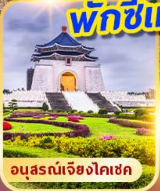
อนุสรณ์เจียงไคเช็ค