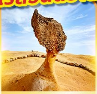
อุทยานหินเหย่หลิว