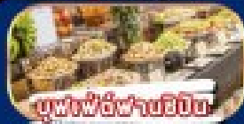
บุฟเฟ่ต์ฟานซีปัน