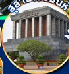
สถานโรมันท์