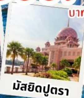
มัสยิดปุตรา