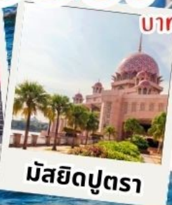
มัสยิดปุตรา