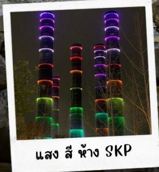
แสง สี ห้าง SKP