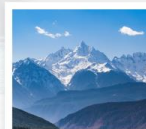
ภูเขาหินเมย์หลี่