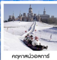
ฤดูหาลานวอลการ