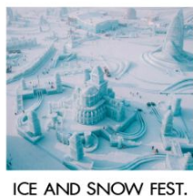
ICE AND SNOW FEST.

คฤหาสน์วอลการ์ (ฟรีเล่น Snow Tubing) โบสถ์เซนต์นิโคลัส / มู่ตันเจียง / ชมแสงสีกลางคืนถนนเส่ยุนเจีย เขาเอะหลัว / เขาปังงูย / ภาพเขียนสี ICE AND SNOW โบสถ์เซินโซเฟีย / เกาะพระอาทิตย์ / เทศกาลแกะสลักน้ำแข็ง