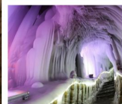
ถ้ำน้ำแข็งหมื่นปี