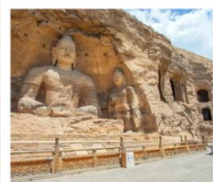
หยุนกิงสี่ถู่