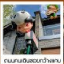
ถนนคนเดินฮอยกว้างเกน