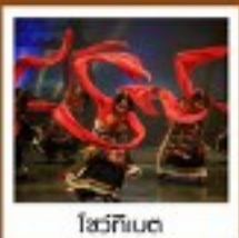
โซ่วทึนเต