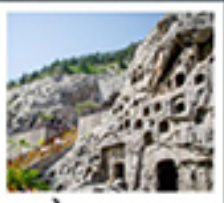
ถ้ำหินหลงหมิน