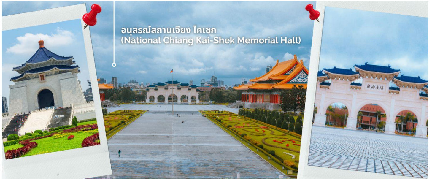
อนุสรณ์สถานเจียง ไคเชก (National Chiang Kai-Shek Memorial Hall)