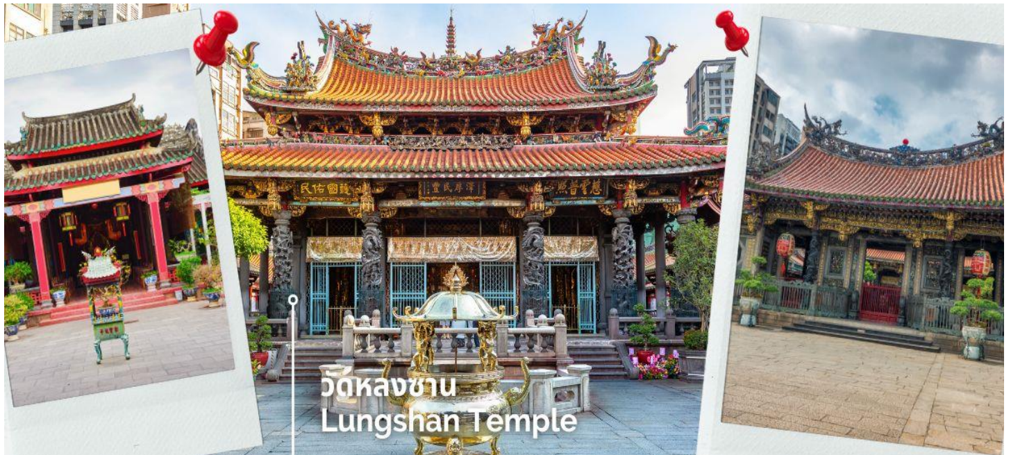
วัดหลงซาน Lungshan Temple

นำท่านสักการะ วัดหลงซาน เป็นหนึ่งในวัดที่เก่าแก่และมีชื่อเสียงมากที่สุดแห่งหนึ่งของเมืองไทเป ตั้งอยู่ในแถบย่านเมืองเก่า มีอายุเกือบ 300 ปี สร้างขึ้นโดยคนจีนชาวผู้เจี้ยนช่วงปีค.ศ. 1738 เพื่อเป็นสถานที่สักการะบูชาสิ่งศักดิ์สิทธิ์ตามความเชื่อของชาวจีน มีรูปแบบทางด้านสถาปัตยกรรมคล้ายกับวัดพุทธของจีน แต่มีลูกผสมของความเป็นไต้หวันเข้าไปด้วย ทำให้ที่นี่เป็นอีกหนึ่งแหล่งท่องเที่ยวที่ไม่ควรพลาด และภายในก็ยังมีเทพเจ้าองค์อื่นๆตามความเชื่อของชาวจีนอีกมากกว่า 100 องค์ด้านในมาจากทั้งศาสนาพุทธ เต๋า และขงจื้อ เช่น เจ้าแม่ทับทิม ที่เกี่ยวข้องกับการเดินทาง, เทพเจ้ากวนอู เรื่องความซื่อสัตย์และหน้าที่การงาน และเทพยเว้วเหล่า หรือ ผู้เฒ่าจันทรา ที่เชื่อกันว่าเป็นเทพผู้ก่อด้ายแดงให้สมหวังด้านความรัก