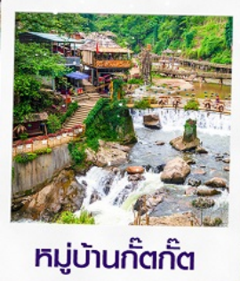
หมู่บ้านก๊อทก๊อต