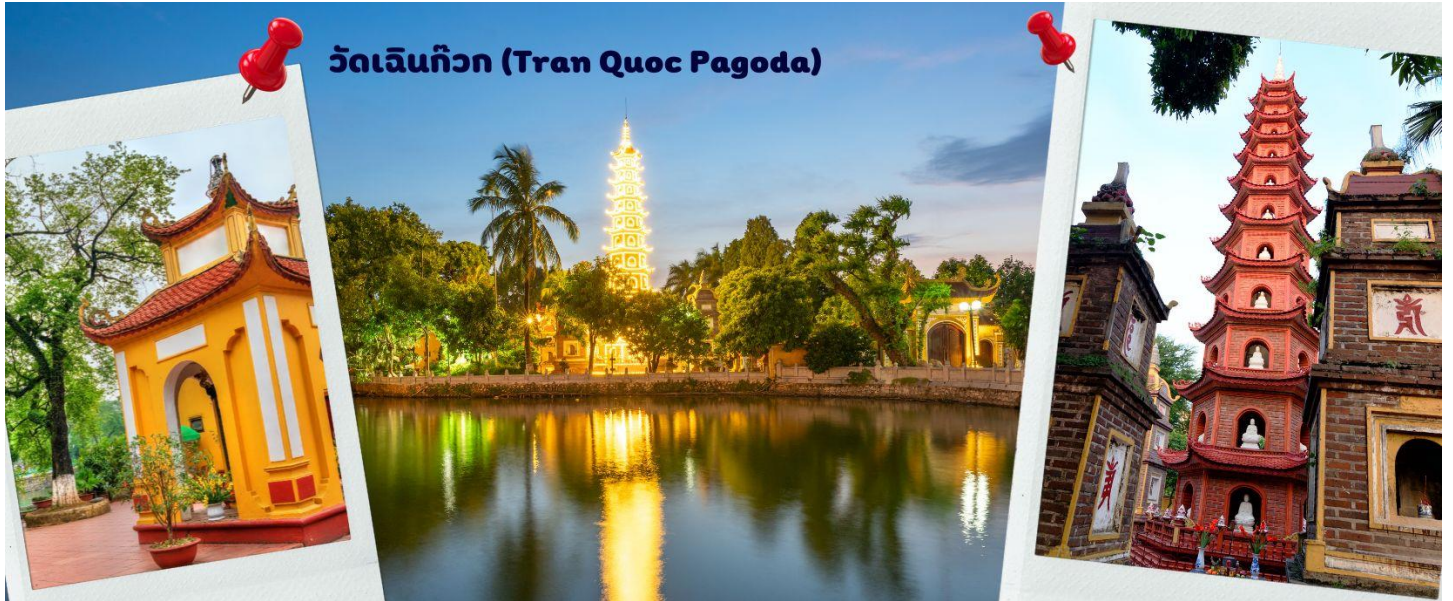
วัดเงินทิว (Tran Quoc Pagoda)

พระพุทธศาสนา จากภาพมุมสูงของสถานที่ตั้ง ที่นี่เหมือนตั้งอยู่บนเกาะที่ยื่นลงไปในทะเลสาบ แต่มีเส้นทางคมนาคมเข้าถึงที่ สิ่งปลูกสร้างมีการวางผังเป็นอย่างดี ใช้สีสันทึกลมกลืนในโทนสีเหลือง น้ำตาล ตัดกับสีเขียวของต้นไม้ใหญ่ที่โอบล้อมอยู่ ในมุมถ่ายภาพจากอีกฝั่งหนึ่ง จะเห็นสิ่งปลูกสร้างสไตล์จีน และเจดีย์หลายชั้นโดดเด่น มีภาพที่สะท้อนลงสู่ผืนน้ำ เป็นภูมิทัศน์ที่งดงามทั้งยามกลางวันและยามค่ำคืนที่มีการเปิดไฟส่องสว่าง