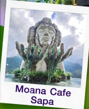
Moana Cafe Sapa