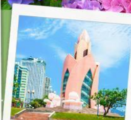
อาคารตอกบัว