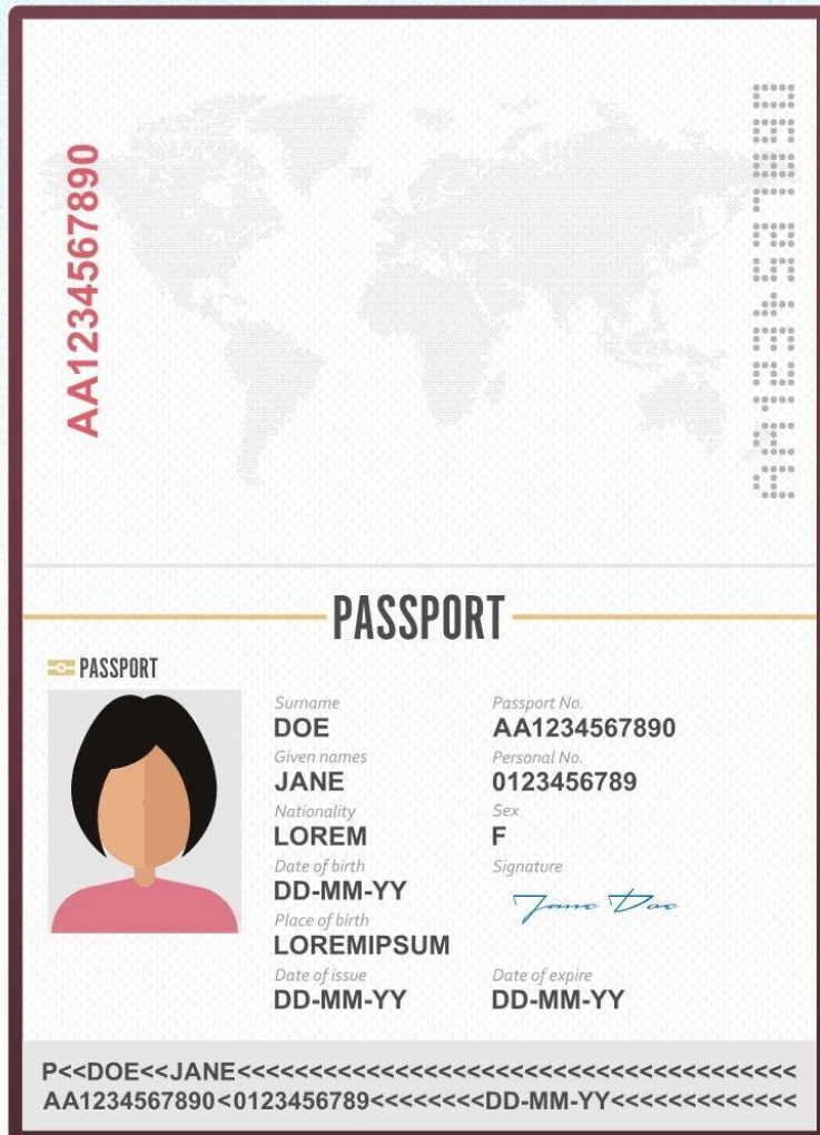
ตัวอย่างโฟล์สแกน รูปถ่าย