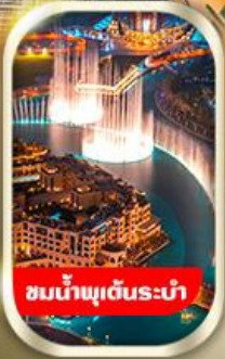
ชมน้ำพุต้นระบำ

นั่งรถ 4WD ชมทะเลทรายอาหารพร้อมทานดินเนอร์อาราเบีย