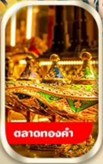
ตลาดทองคำ