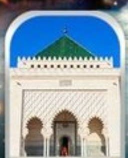
MOHAMMED V SQUARE