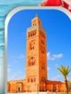
JEMAA EL-FNAA MARRAKESH