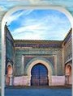
KASBAH OF MOULAY ISMAIL